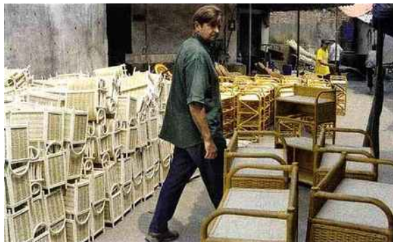
Des activités tous azimuts. En Afrique du Sud, ci-dessus, en 2004. A gauche, au Vietnam, en 2006, dans une usine de meubles. A droite, avec Michel Lalande, de la préfecture de police de Paris, et Bertrand Delanoë, pour soutenir SOS drogue.

même, est plus un organisateur qu'un gestionnaire. Pour gérer les restaurants de Régine, il avait potassé en accéléré les Que Sais-Je ! Pour SOS, il a préféré recruter des centraliens et des polytechniciens. A chacun son métier. Et, efficacité oblige, toutes les fonctions centrales (finance, RH, communication...) sont regroupées dans un GIE. Cette gestion digne du privé attire les donneurs d'ordre publics, qui affluent pour lui proposer la reprise de structures en difficulté. Parallèlement, grâce à son épais