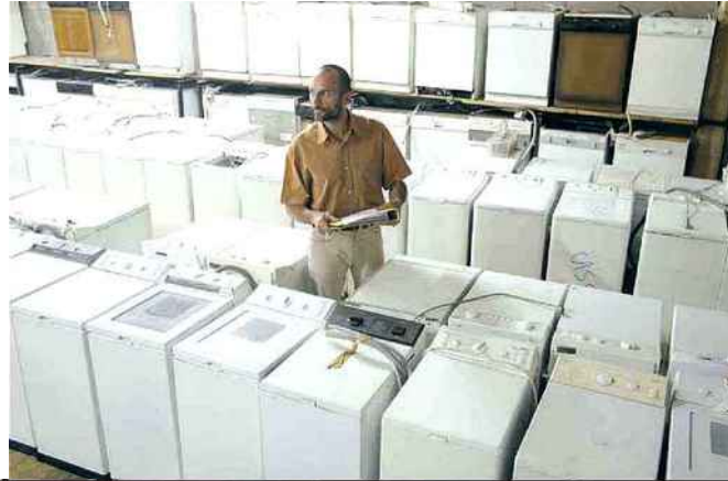
Fort de 48 entreprises en France, le réseau Envie récupère et revend ou recycle, selon les cas, les appareils électroménagers (photos : à Saint-Herblain et à Grenoble).

Au total, Alterna emploie 130 salariés, dont 70 postes à temps plein pour des personnes en insertion, et cumule un chiffre d'affaires de 8 millions d'euros. « Notre projet économique est pleinement dans le champ concurrentiel, mais avec en ligne directrice un projet social: l'ANPE nous envoie des candidats, à charge pour