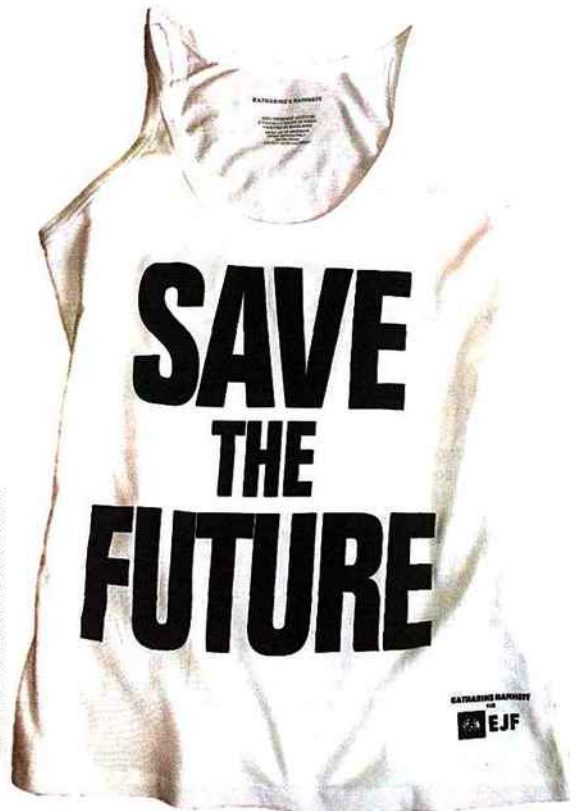
À gauche : collection de lampes "Mon beau sapin, roi des trottoirs", réalisée par les S.5 Designers en 2008, à partir de sapins de Noël récupérés. À droite : le tee-shirt récemment signé par Katharine Hamnett pour la Fondation pour la justice environnementale.